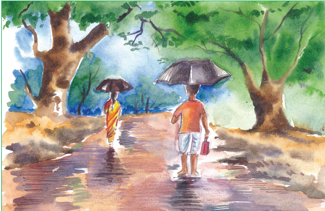
Bandita Pathak, X-C

MODERN ENGLISH SCHOOL Think · Feel · Achieve