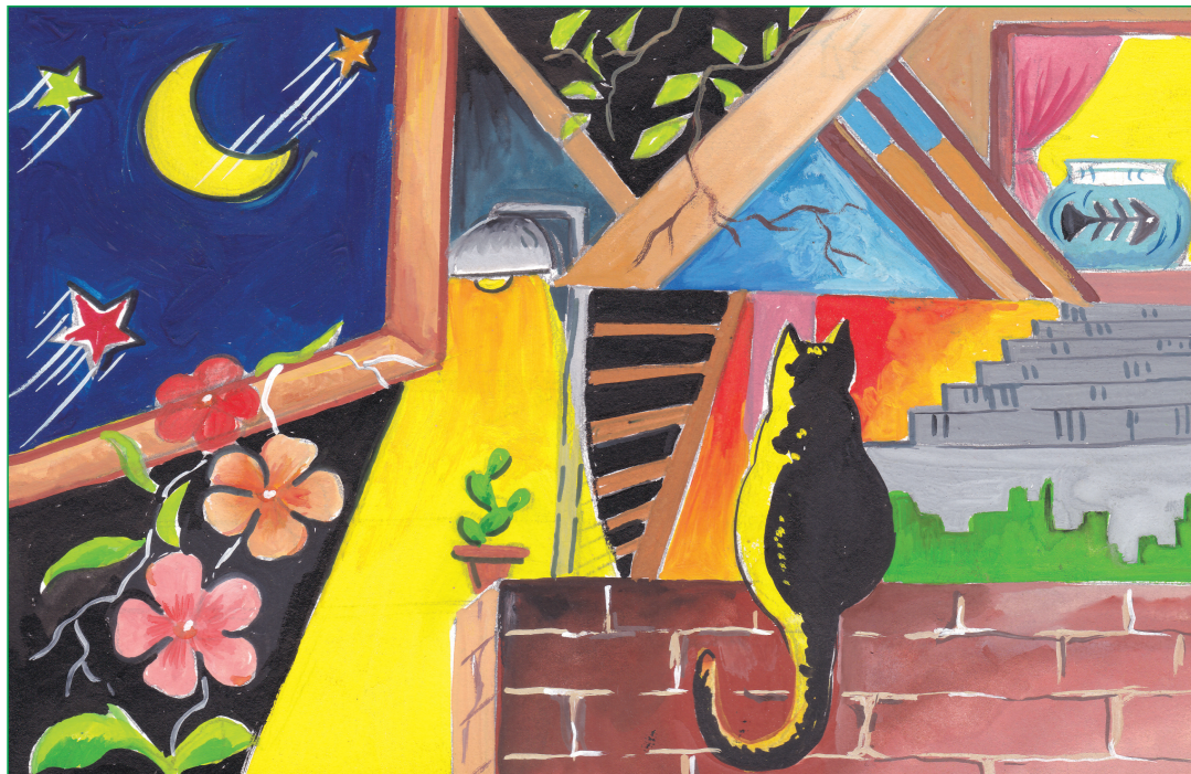
Niharika Sarma, V-A

MODERN ENGLISH SCHOOL Think · Feel · Achieve