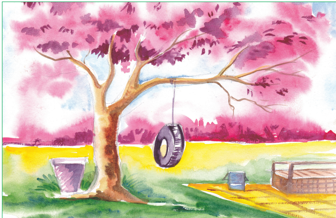
Harshita Talukdar, X-C

MODERN ENGLISH SCHOOL Think · Feel · Achieve