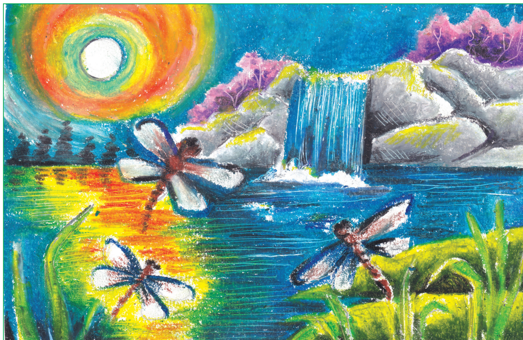
Akshita Roy, II-C

MODERN ENGLISH SCHOOL Think • Feel • Achieve