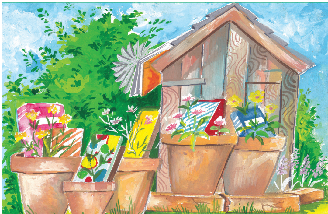
Pratiksha Saikia, VII-A

MODERN ENGLISH SCHOOL Think · Feel · Achieve