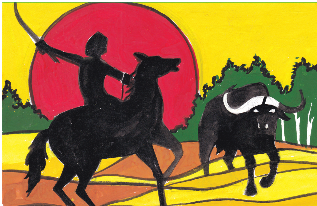
Eshakshi Bharadwaj, VIII-C

MODERN ENGLISH SCHOOL Think · Feel · Achieve