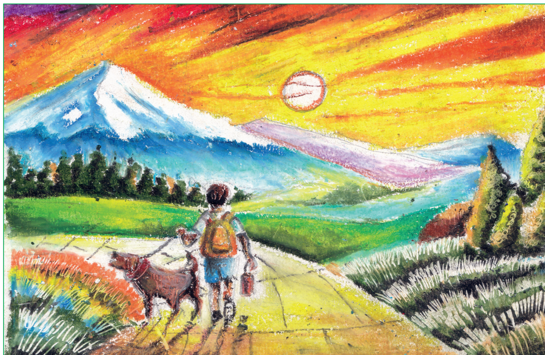
Trinayan Das, IV-A

MODERN ENGLISH SCHOOL Think · Feel · Achieve