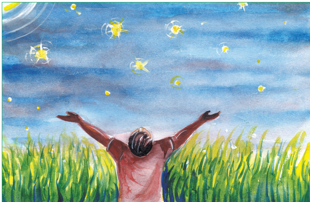
Nibir Saikia, V-C

MODERN ENGLISH SCHOOL Think • Feel • Achieve