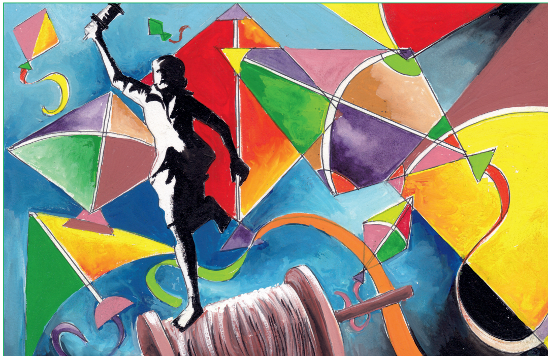
Ranakravit Gogoi, VI-A

MODERN ENGLISH SCHOOL Think · Feel · Achieve